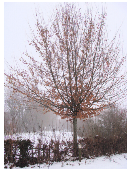
Jeune trogne de charme

Rejet : jeune pousse sur le tronc ou la souche d'un arbre coupé