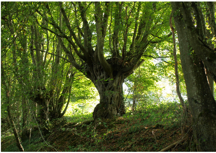
Vieille trogne de charme